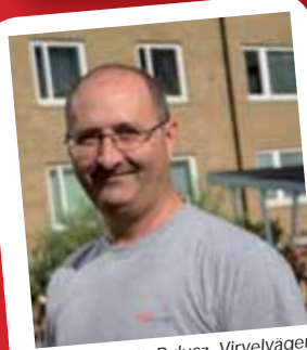
Dorin Bulucz, Virvelvägen, Betlehemsgratan, V. Promenaden, Elisetorpsvägen 7, Strandgratan, Pilevallen