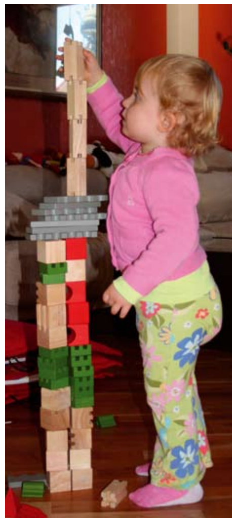
Utan hemförsäkring kan tillvaron snabbt rasa om olyckan är framme.

I hemförsäkringen ingår reseförsäkring upp till 45 dagar. Ska man vara borta mer än 45 dagar erbjuder vi en Tur & Returförsäkring för 30 kronor/månad.