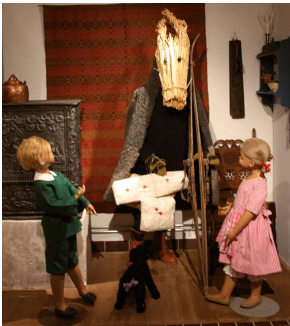
Förr ansåg man att getabocken var skapad av hin onde och därmed symboliserade honom. Under 1800-talet blev han juklappsutdelare i borgerliga kretsar men i slutet av 1800-talet efterträddes julbocken av jultomten.

För att stärka sig mot alla farligheter borde man äta frukost tre eller på vissa håll sju gånger innan man tog sig an dagens sysslor. Ofta smakade man på det som var färdigt av julmaten.