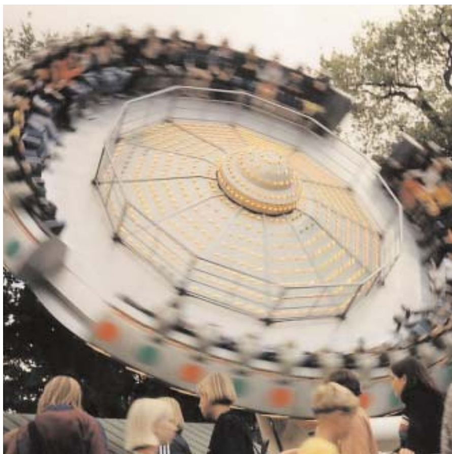
Det går runt för LH Svenshög.

När man mötte en del reskompisar kunde man snabbt se om det var