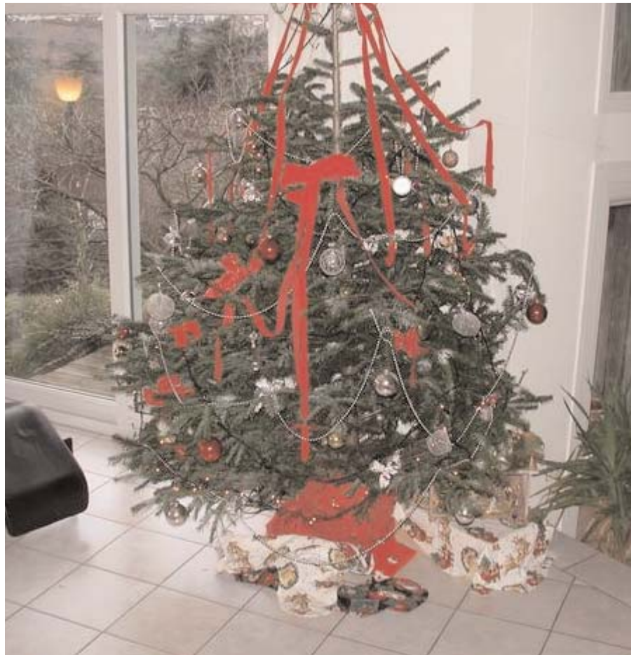
De julklappar som inte får plats i strumpan eller skorna placerar tomten Père Noël under granen.

Förutom att barnen får presenter på Sankt Nicholasdagen ger man "bonus" till tjänstemän, företagen ger till sina anställda och privatpersoner ger till de tjänstemän vilka man kommit i kontakt med mycket under året, vanligtvis brevbäraren.