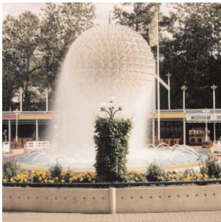
Strilande, strålände väder på Liseberg.

attraktionen Flumeride (man blev blöt) eller sådant som centrifugerar sina åkare (blek om näsan) som fått senaste besöket. Alla hade dock ett leende på sina läppar.