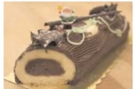
Att servera la bûche de Noël (julstubbe) som dessert på det franska julbordet har anor sedan medeltiden.

I Frankrike åker inte tomten runt och delar ut julklappar själv utan han har sällskap av sin medhjälpare Père Fouettard, som hjälper tomten Père Noël att ha koll på hur barnen har skött sig under året som gått. Medan barnen sover, kommer julmoten och lägger godis eller någon julklapp i barnens skor som de ställer fram innan de går och lägger sig och res-