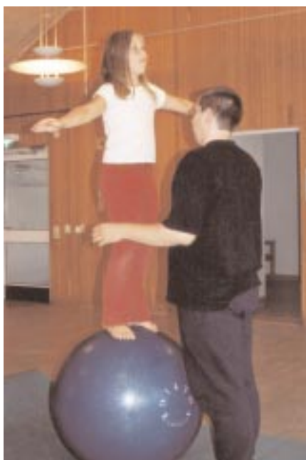
Kanske en blivande cirkusprinsessa?