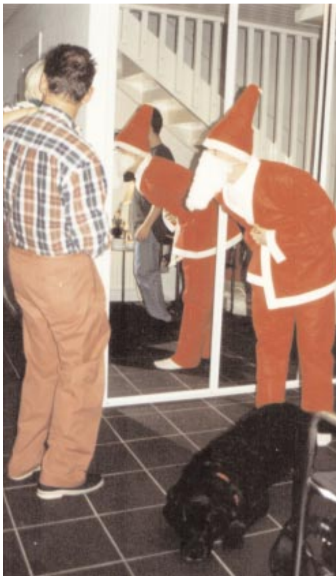
Traditionerna är de samma i både Danmark och Sverige. Oftast är det pappa som går ut och köper tidningen.