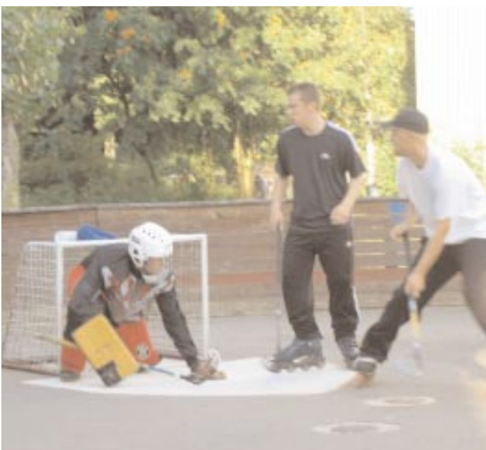
Tempot är högt men stämningen god hos landhockeygänget på Svenshög.

Vi får hoppas att deras önskemål blir uppfyllda. Till dess rullar livet vidare för landhockeygrabbarna på Svenshög och att de har roligt tillsammans, ja det går inte att ta miste på.