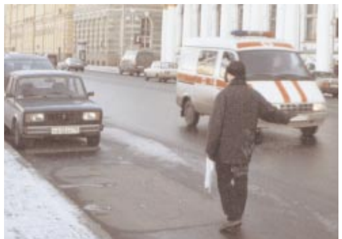
Har man ingen egen bil och inte vill åka kollektivtrafik haffar man en bil på gatan.

Kollektivtrafiken är hektisk. Spårvagnar och trådbussar är för det mesta fullsatta men de har även små minibussar som tar cirka 10 personer. Dessa bussar har inga hållplatser utan kör en speciell rutt. Vill man åka med tar man upp tummen varvid bussen stannar. Sen går man upp och sätter sig. Hamnar man långt bak i bussen knackar man framförvarande passagerare i ryggen, ber honom skicka fram biljettpengar till chauffören. Passageraren skickar sedan pengarna vidare