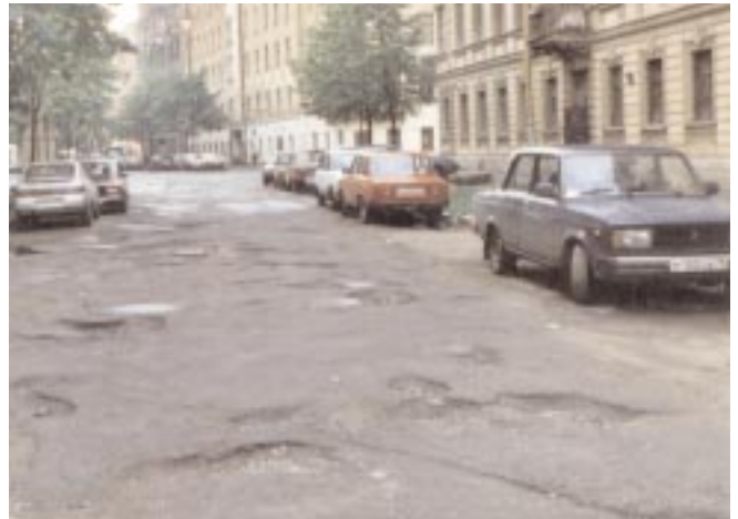
Det gäller att ha rejäla stötdämpare på bilen när man kör i S:t Petersburg.

Efter kommunistregimens fall passade många på att köpa upp de tidigare statligt ägda fabriker. Många tjänade stor-kovan och mycket köptes upp av dem som våra svenska tidningar kallar för den ryska maffian. Många av dessa människor har numera försvunnit, de har helt enkelt utplånat sig själv genom att skjuta ihjäl varandra.